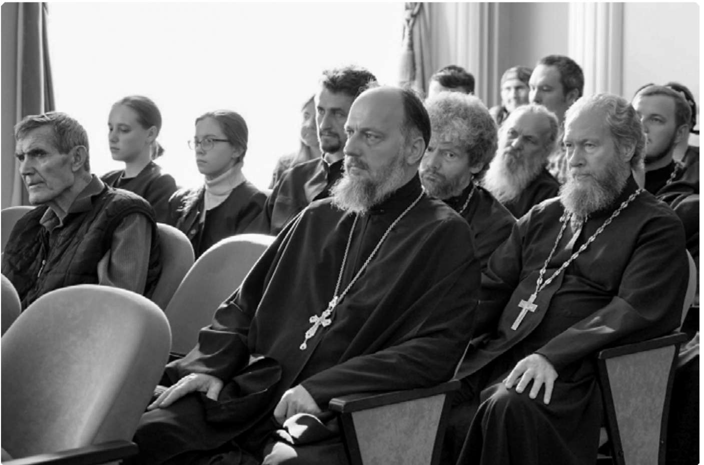
Духовенство Бийской епархии на встрече с правящим архиереем. Центральная городская библиотека им. В.М. Шукшина. Бийск. 12 октября 2022 г.

Иван Литвинов