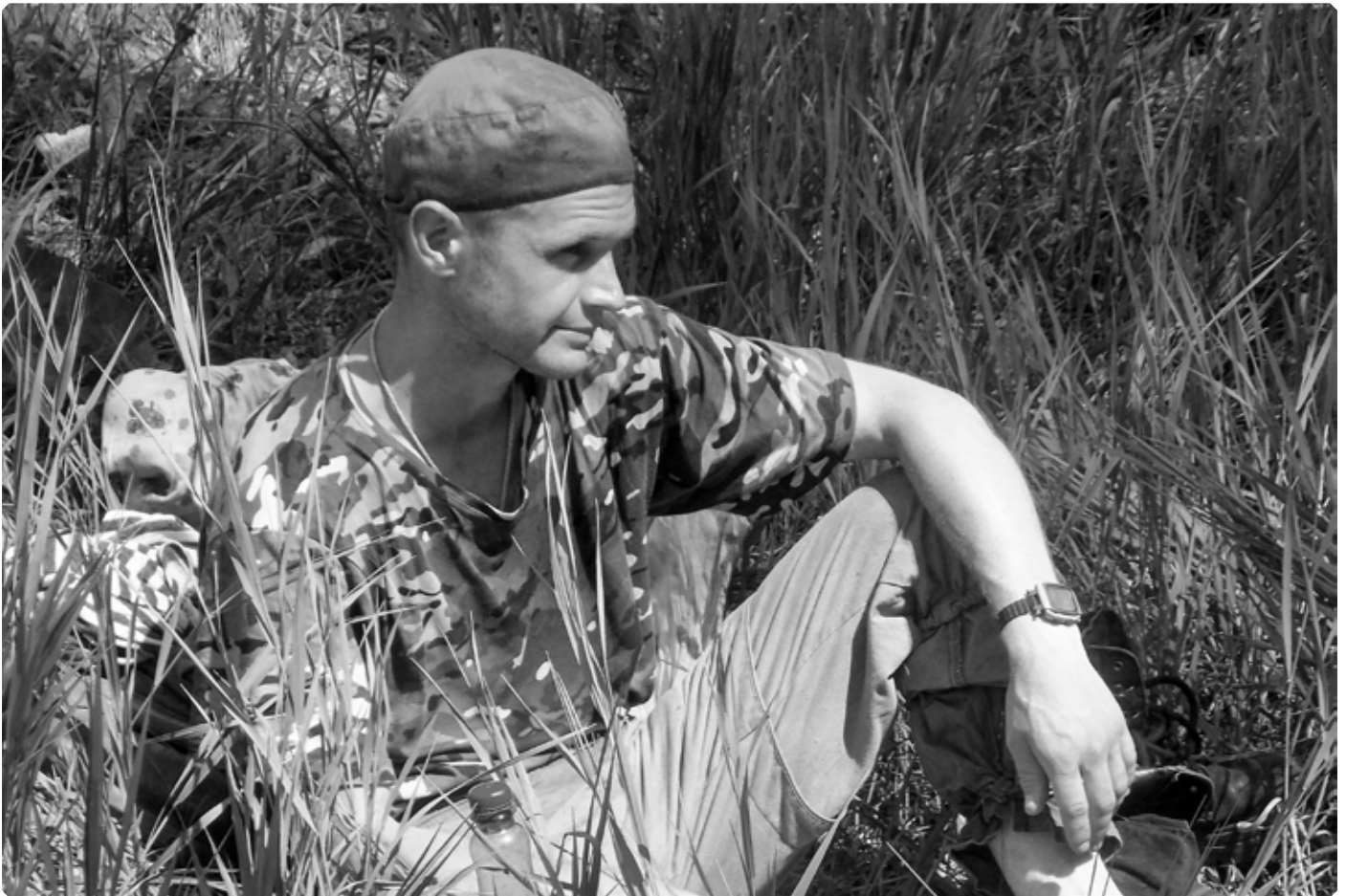
Отдых на пути в село Ануйское. 26 июня 2022 г.