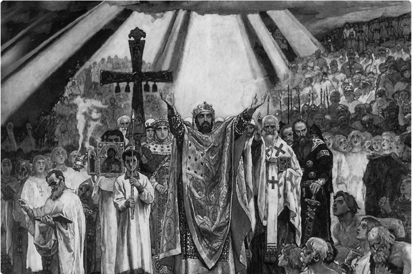
Виктор Васнецов. Крещение Руси. 1885–1896. Фрагмент. Х., м. ГТГ

Святейший Патриарх Московский и всея Руси Кирилл за Божественной литургией, совершенной 25 сентября 2022 года в Александро-Невском скиту близ Переделкина, вознес молитву о Святой Руси.