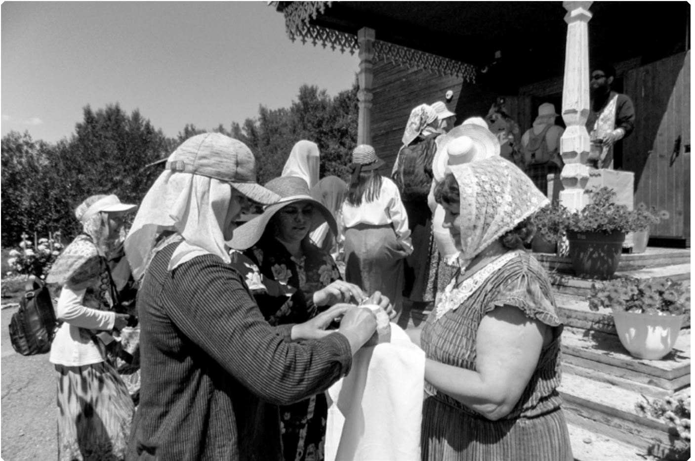
Встреча крестоходцев в Смоленском. 25 июня 2022 г.

Смоленская икона Божией Матери, как и Коробейниковская-Казанская, относится к иконографическому типу Одигитрия, в переводе с греческого – Указующая Путь, Путеводительница. В XIX веке в Смоленском была возведена новая церковь, сохранившая преемственность в названии: дореволюционные справочные книги по Томской епархии именуют ее Одигитриевской.