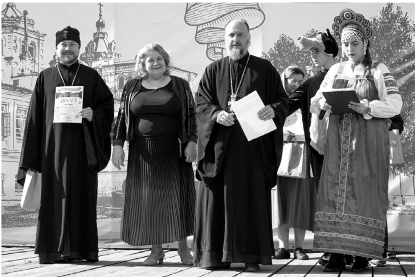
Вручение дипломов участникам ярмарки. Бийское архиерейское подворье. 24 сентября 2022 г.