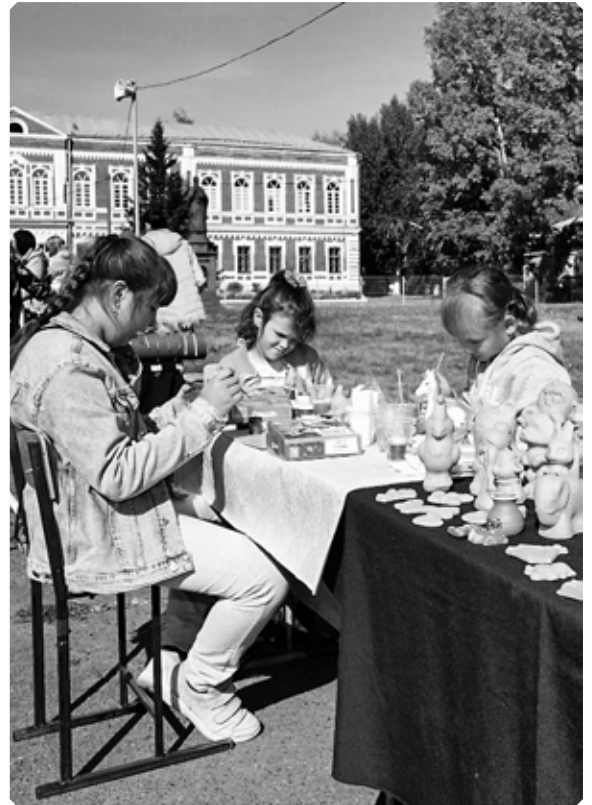
Мастер-класс по росписи керамических изделий. Крестовоздвиженская ярмарка.