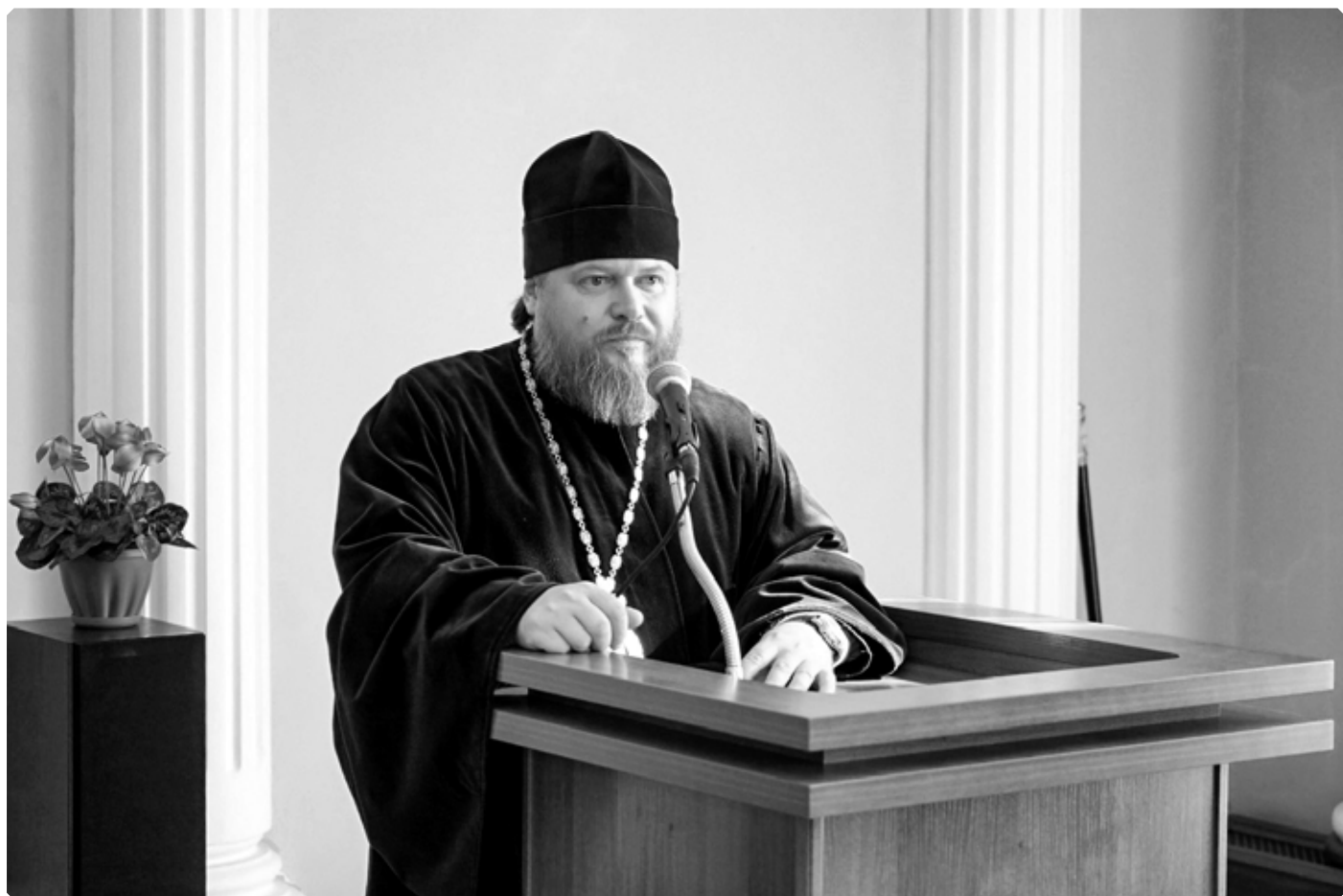
Преосвященный Серафим, епископ Бийский и Белокурихинский.

ний. С 2005 года этот церковно-общественный форум стал посвящаться определенным темам. Предстоящие XXXI Международные Рождественские образовательные чтения на тему «Глобальные вызовы современности и духовный выбор человека» пройдут в столице с 25 по 27 января 2023 года.