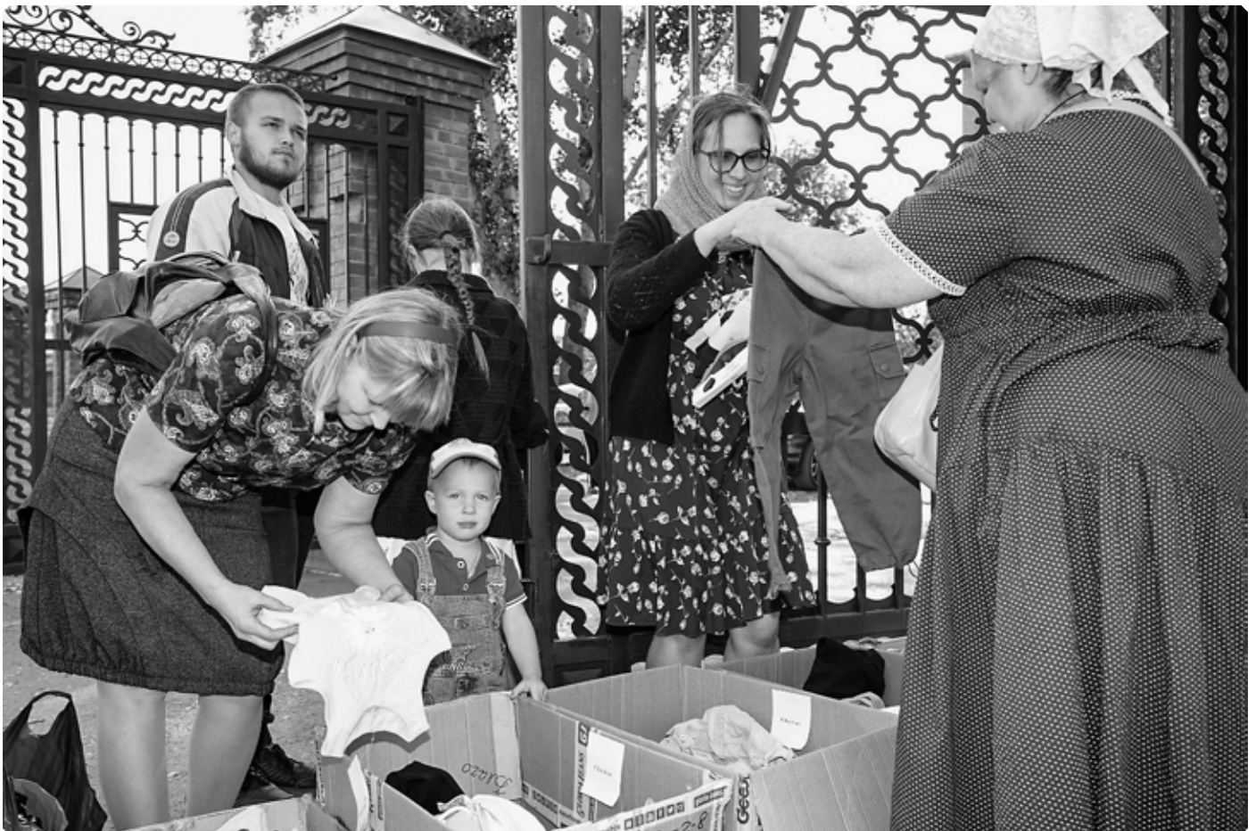
Работа епархиального отдела по церковной благотворительности и социальному служению.

Крестовоздвиженская ярмарка. Бийское архиерейское подворье. 24 сентября 2022 г.