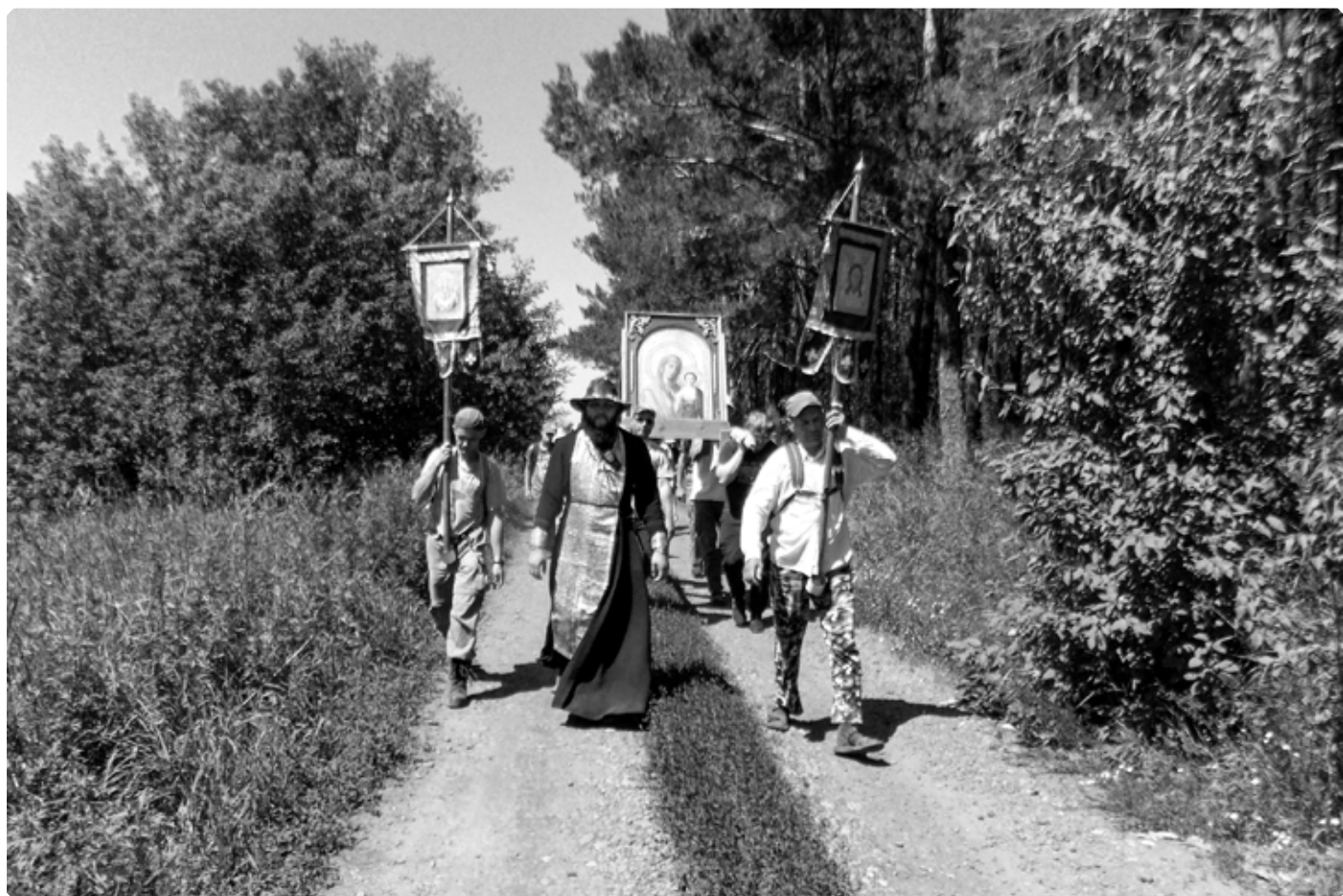
На пути из Линевского в Смоленское. 25 июня 2022 г.

Следующей стоянкой на нашем пути стало село Смоленское – районный центр, расположенный при впадении небольшой речки Поперечной в реку Песчаную, приток Оби. Название села связано не с городом Смоленском в Европейской части России, а со Смоленской иконой Божией Матери, храм в честь которой был построен здесь еще во второй половине XVIII века. В православной России церковь занимала центральное место в жизни крещеных людей, поэтому названия многих населенных пунктов происходили от расположенных в них храмов. Так на карте страны появлялись многочисленные Рождественские, Вознесенские, Троицкие, Благовещенские, Покровские, Петропавловские, Никольские и Казанские сёла. В числе подобных оказалось и Смоленское.