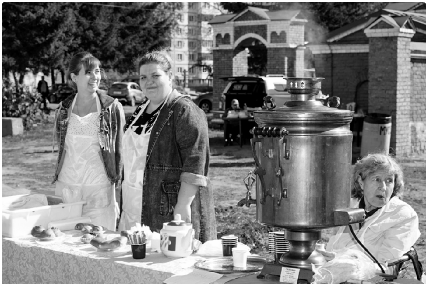
Какой праздник без чаепития и тульского самовара?! Бийское архиерейское подворье. 24 сентября 2022 г.