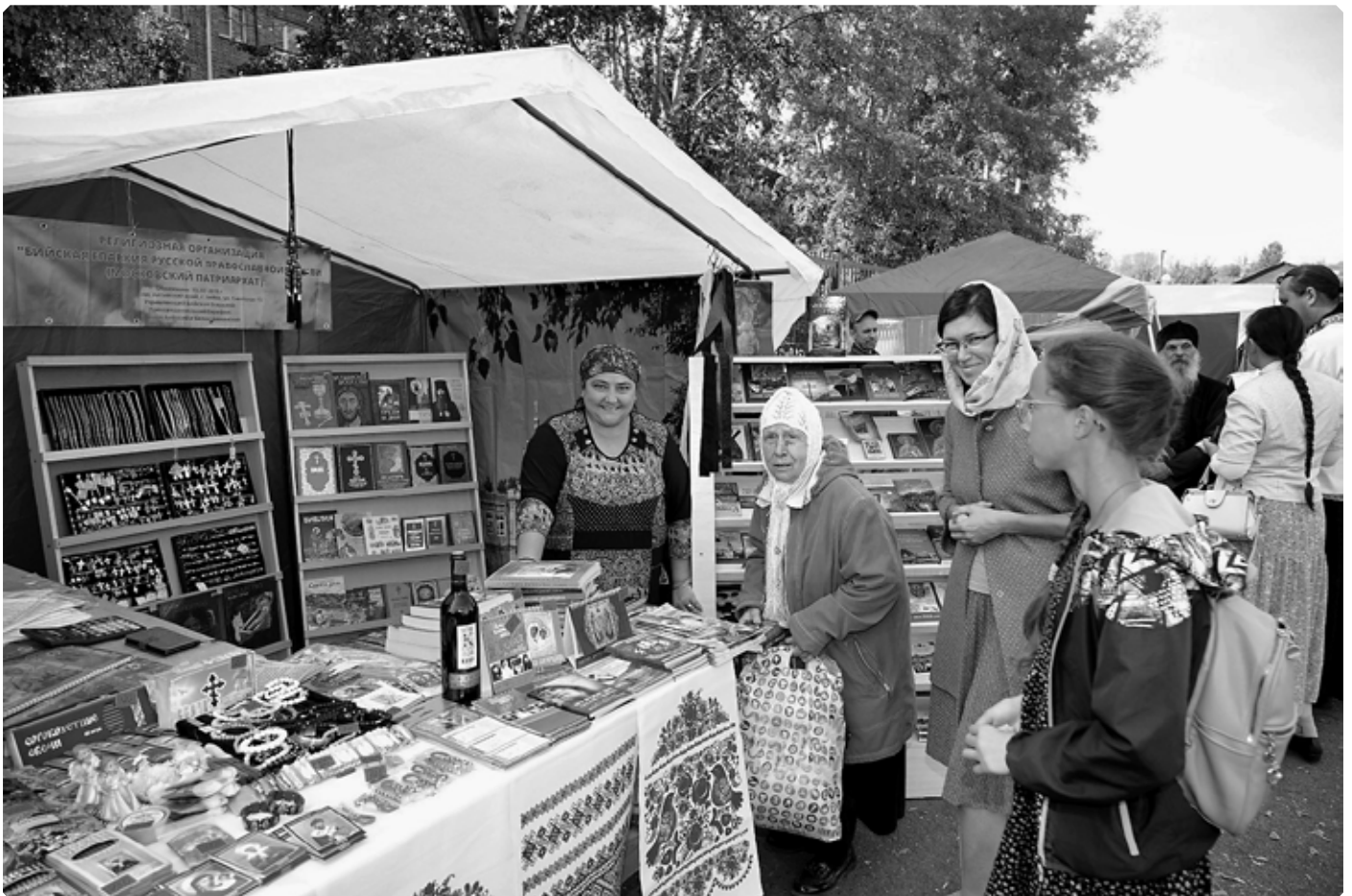
Крестовоздвиженская ярмарка. Церковная лавка епархиального склада.

Хочу обратить ваше внимание на то, что на ярмарке представлены не только плоды нынешнего урожая и продукция перерабатывающих