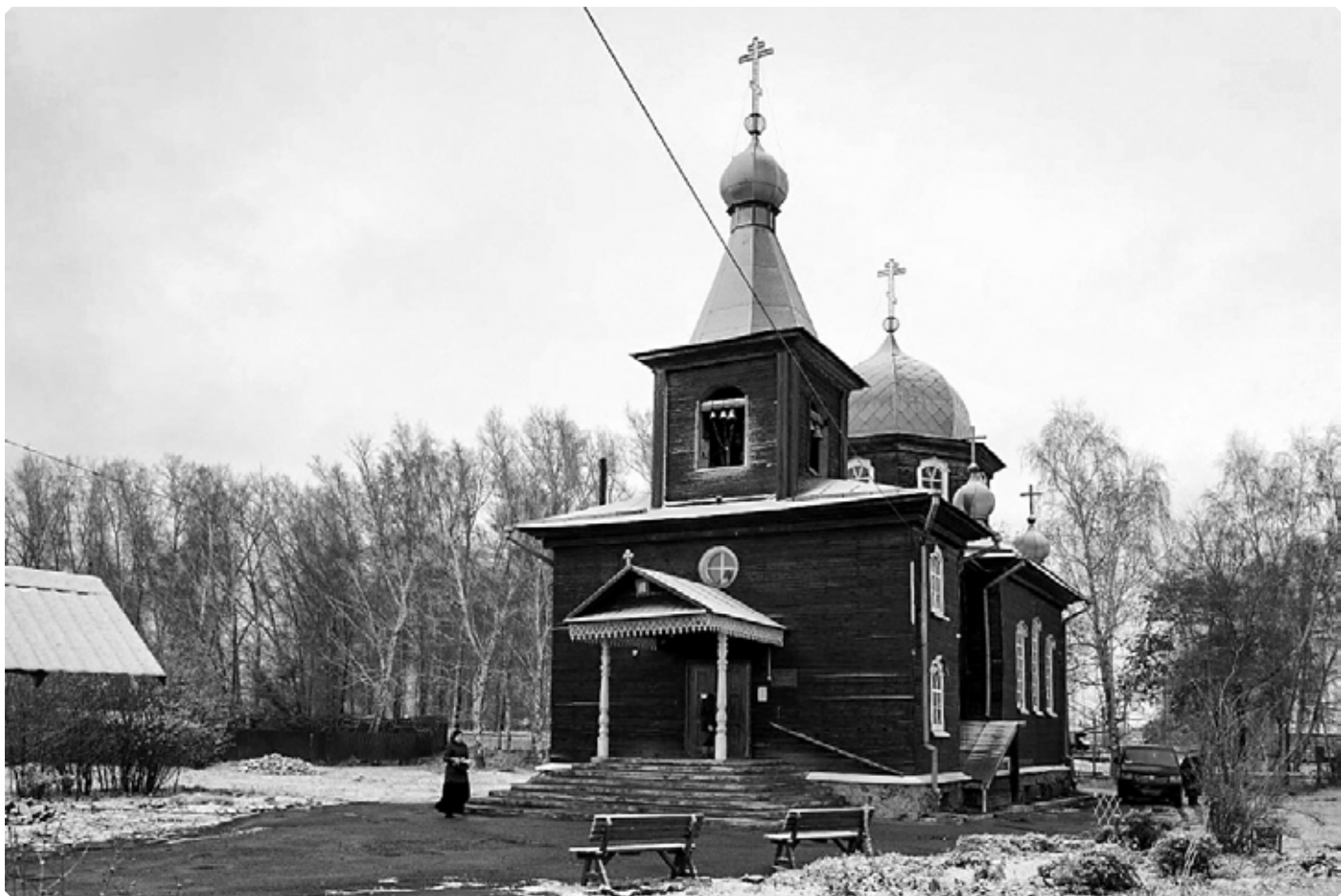
Храм Смоленской иконы Божией Матери. Село Смоленское. 24 октября 2020 г.