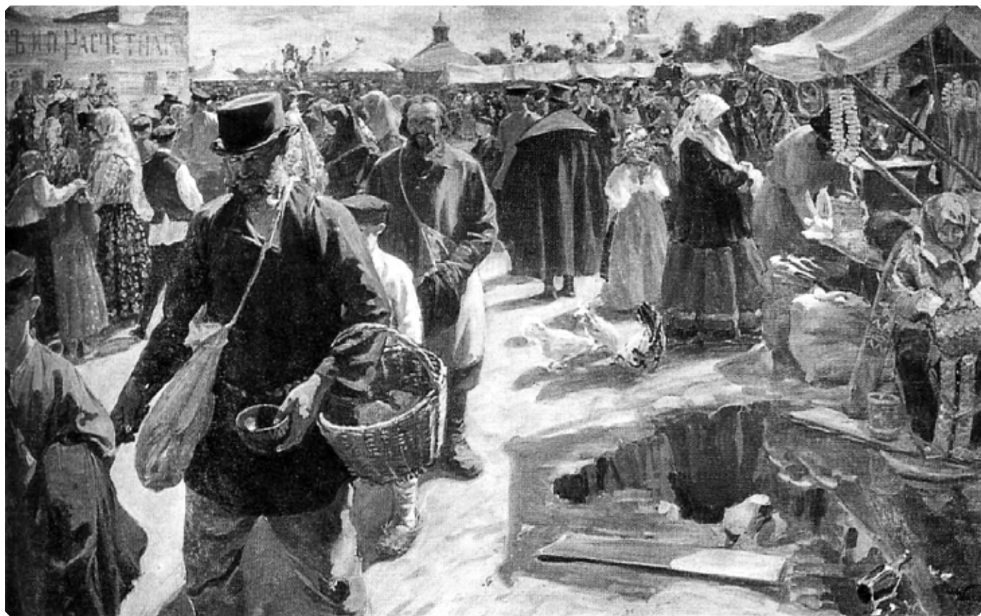
Иван Куликов. Ярмарка в Муроме. 1910–1912. Х., м. Муромский историко-художественный музей

24 сентября, в преддверии праздника Всемирного Воздвижения Честного Животворящего Креста Господня, по благословию епископа Бийского и Белокурихинского Серафима на площади архиерейского подворья прошла православная ярмарка.