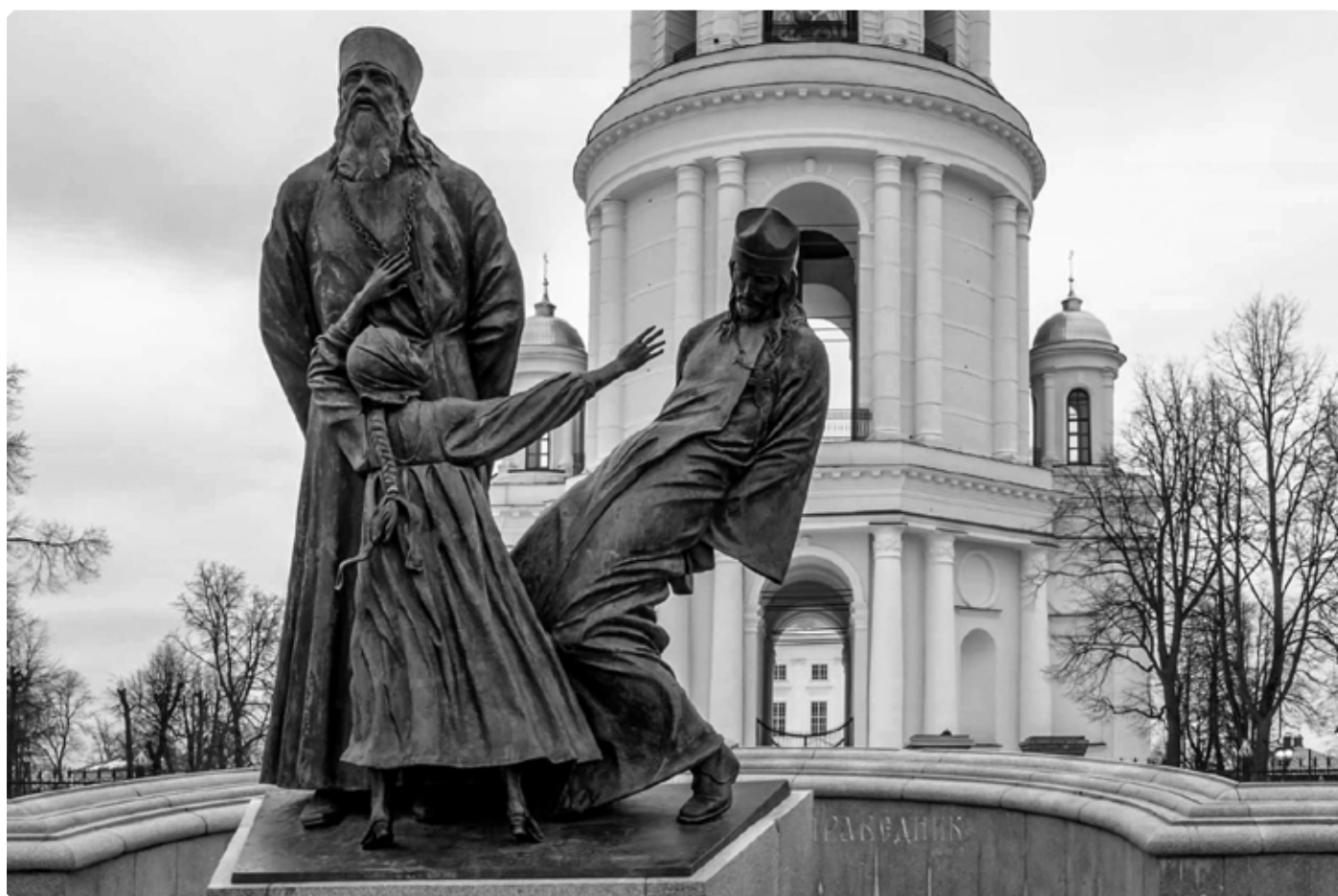
Памятник священнослужителям и мирянам, пострадавшим за веру Христову. Скульптор – Александр Рукавишников. 2007 г. Город Шуя, Ивановская область.