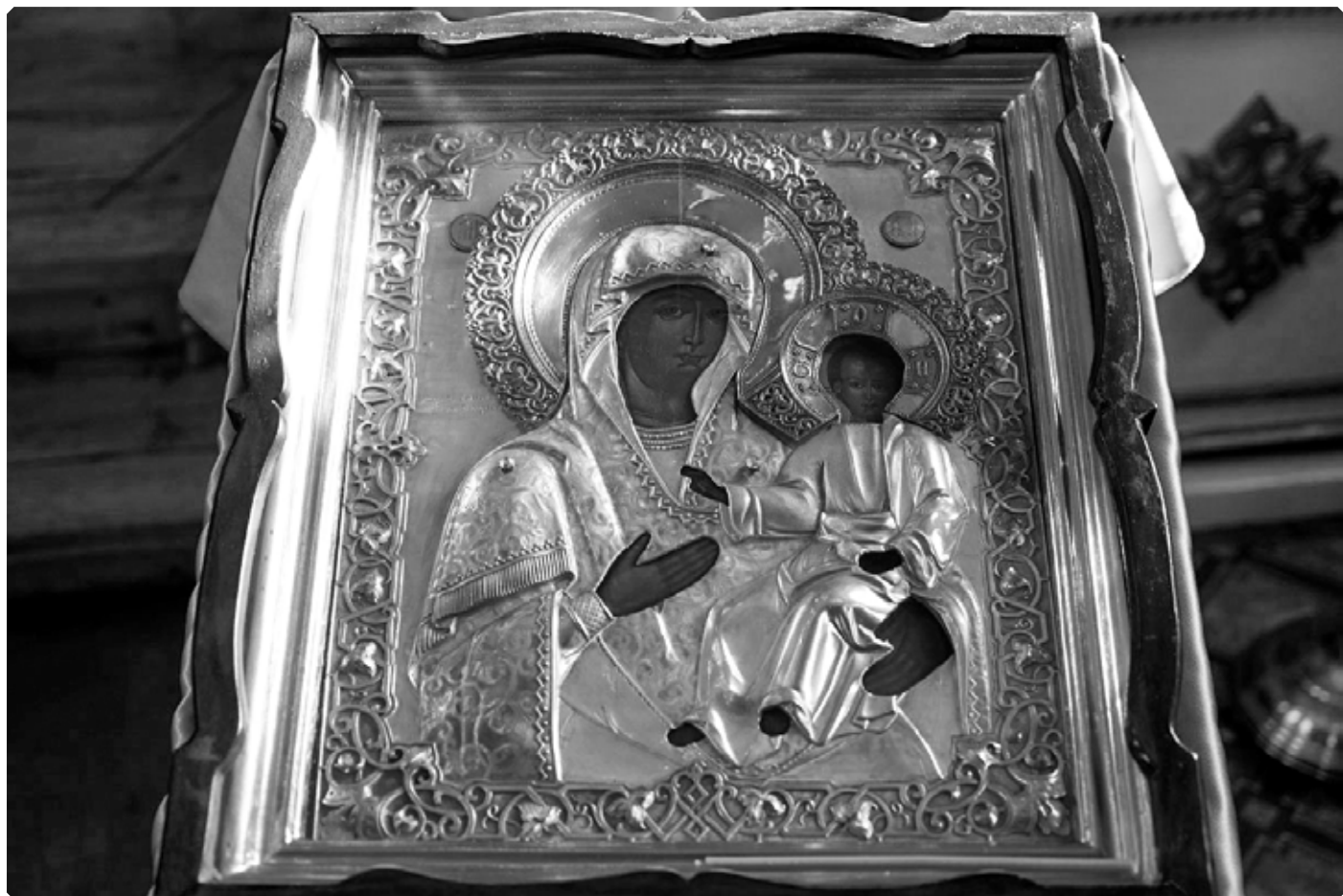
Смоленская икона Божией Матери. Село Смоленское. 24 октября 2022 г.