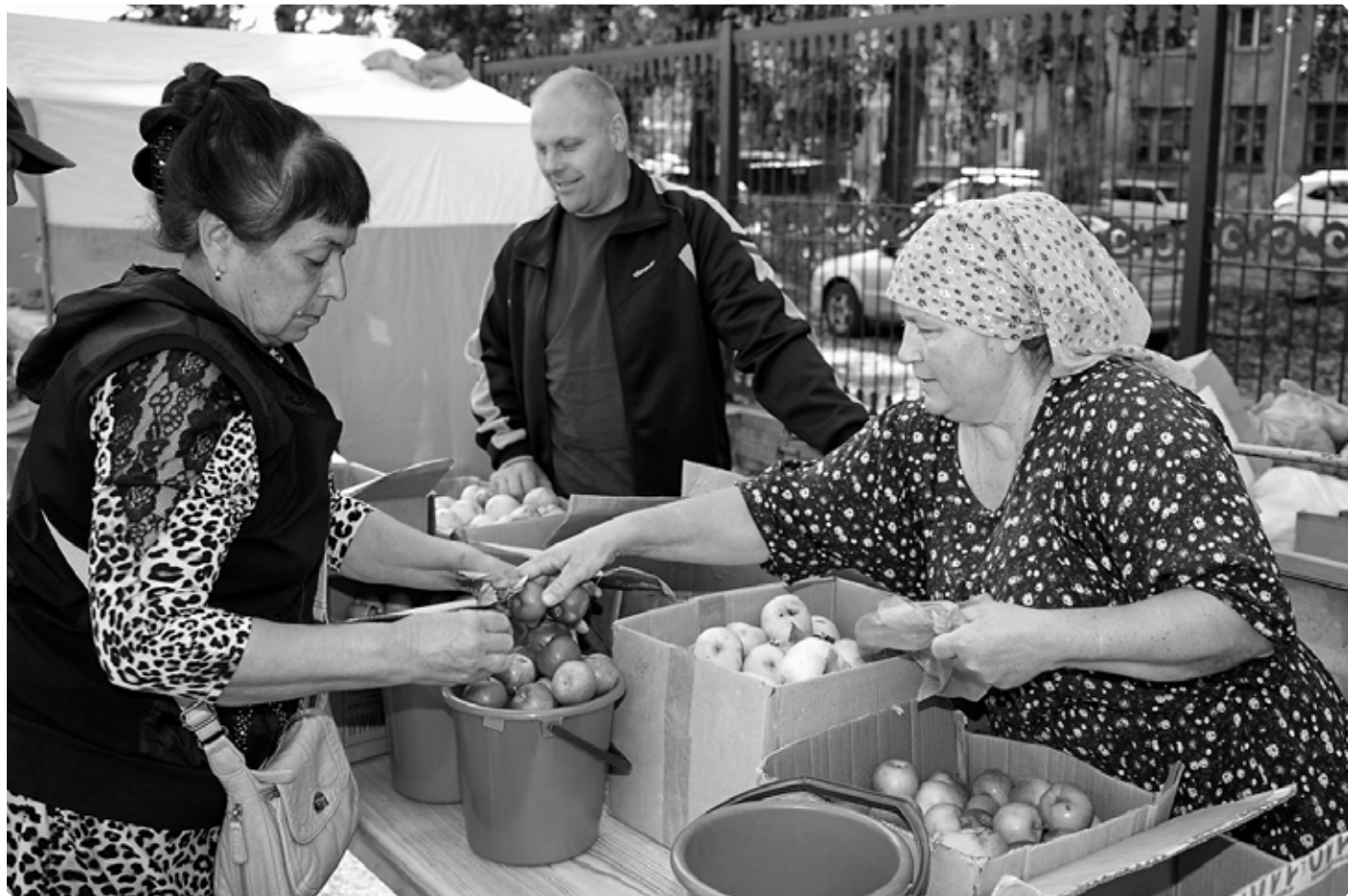
Яблочки из Алтайского – популярный бренд Крестовоздвиженской ярмарки. Бийское архиерейское подворье. 24 сентября 2022 г.

Иван Литвинов