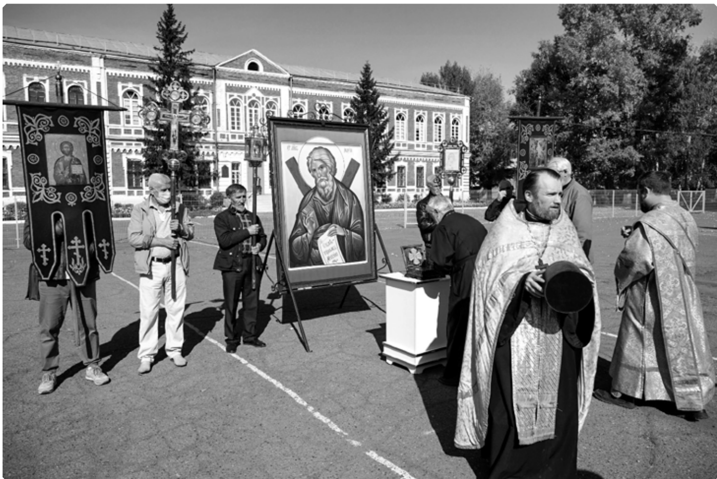
Икона апостола Андрея Первозванного и ковчег с частицей его святых мощей на Архиерейском подворье. Бийск. 24 сентября 2022 г.