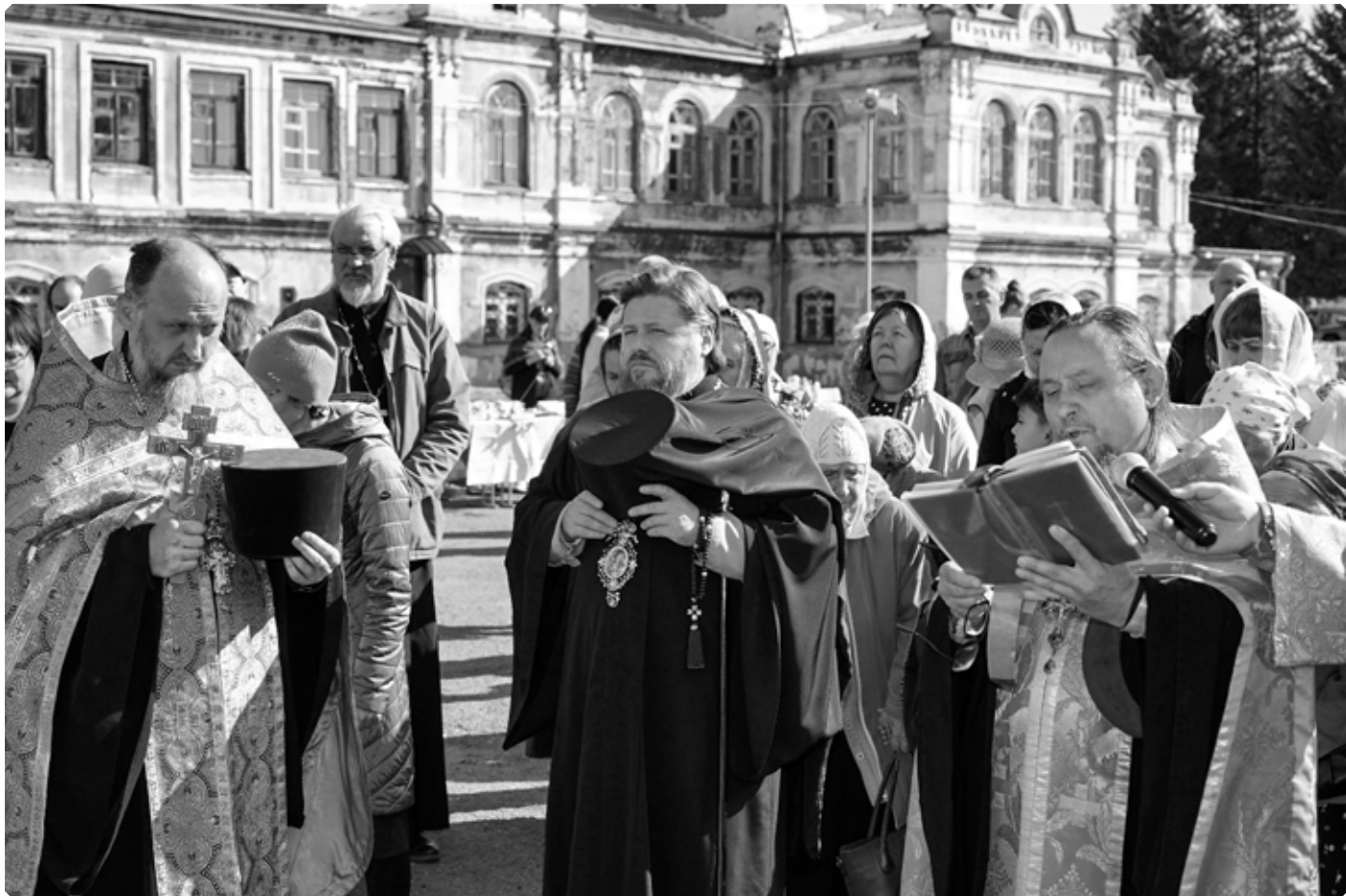
Преосвященный Серафим на молебне перед открытием Крестовоздвиженской ярмарки. Бийское архиерейское подворье. 24 сентября 2022 г.