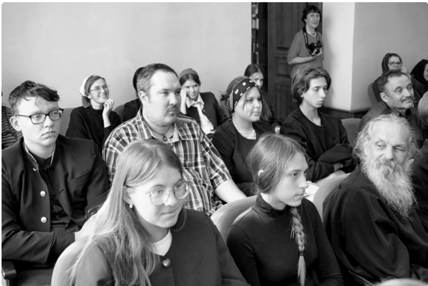
В конференц-зале Центральной городской библиотеки им. В.М. Шукшина. Бийск. 12 октября 2022 г.

начинается организованное движение паломников к храму Гроба Господня. В самом храме наша группа оказалась в десятом часу. Достаточно просторно. Прохладно. Еще около двух часов можно было свободно передвигаться по храму от святыни к святыне. Но присесть некуда. Вскоре стал давать о себе и груз: свечи и питьевая вода. Стала накапливаться усталость. С барабанным боем и выкриками: «Наша вера – правая, наша вера – православная!» в храм ворвалась арабская молодежь. Появился Патриарх, и вокруг кувуклии начался крестный ход. Несмотря на небольшое пространство, на него потребовалось еще минут сорок. Приближается кульминация: разоблаченный Патриарх входит в кувуклию. Общее напряжение растет, а мной совершенно овладевают усталость и... безразличие. Появляется Огонь. Через полминуты-минуту полыхает весь храм. Я достаю приготовленные свечи, зажигаю их и вдруг понимаю, что усталости нет! Она ушла сама собой и появилась радость. Непривычное для нас бурное житейское чувство, а спокойная, особенная радость, в тихом дуновении пришедшая ко мне. Это была радость о Христе. Радость о Его Воскресении, радоваться которой Он призвал пришедших ко гробу жен-мироносиц. Перелеты и пере-